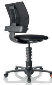
3Dee , Sitzschale und Fußkreuz Aluminium schwarz