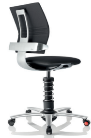
3Dee , Sitzschale und Fußkreuz Aluminium poliert